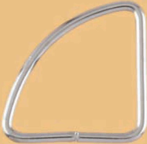
REF. 201 TRIÁNGULO SOLDADO