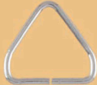
REF. 202 TRIÁNGULO ESPECIAL